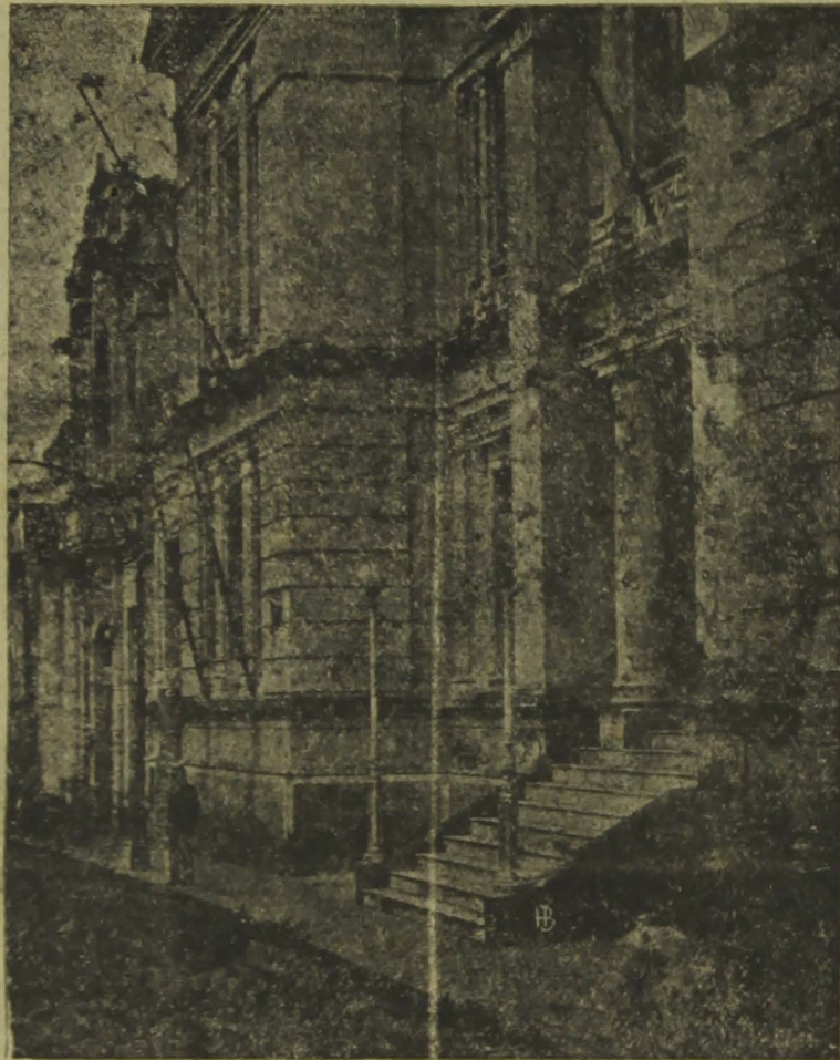
Edifício da Associação Commercial, á rua Maciel Pinheiro

Em nome da União dos Retalhistas encontrava-se no recinto grande comissão, presi-